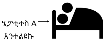
ሄፓቲተስ A እንተልዩኩ ሄፓቲተስ A ምስ ዘለዎ