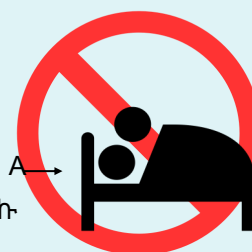
ሄፓቲተስ A እንተልዩኩ ሄፓቲተስ A ምስ ዘለዎ/