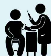
ናይ ሄፓቲተስ A