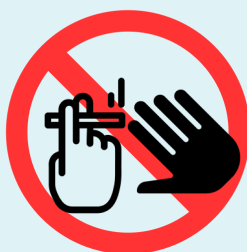
መግቢ፣ መስተ፣ መራፍእ፣ ወይ ድማ ሽጋራታት ምስ