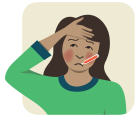
ມີໄຂ້ Have fever

If you become sick with TB disease, you might: