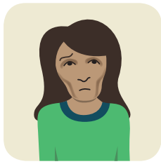
ນ້ຳໜັກຫຼຸດ Lose weight