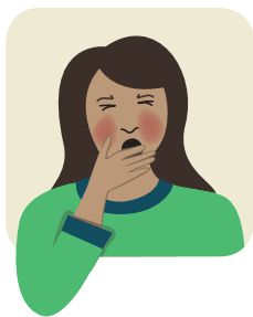
ຮູ້ສຶກເມື່ອຍ Feel tired