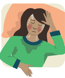
ເຫືອອອກຕອນກາງຄືນ Sweat at night

ຖ້າທ່ານບໍ່ສະບາຍຈາກພະຍາດປອດແຫ້ງ (TB), ທ່ານຍັງສາມາດແຜ່ເຊື້ອພະຍາດປອດແຫ້ງໄປຕິດໃສ່ຄອບຄົວ ແລະ ຄົນອື່ນໆໄດ້.