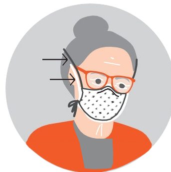
អ្នកអាចពាក់ម៉ាស់ធ្វើពីសាច់ក្រណាត់ពីលើម៉ាស់ដែលពាក់រួច បោះចោល

សូមទុកម៉ាស់ប្រភេទ N95s អោយអ្នកធ្វើការថែទាំសុខភាពប្រើប្រាស់។