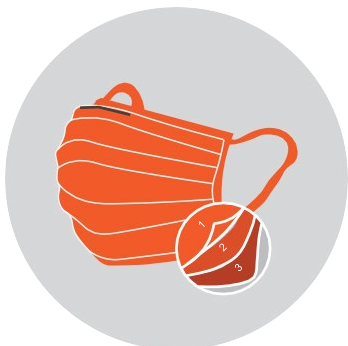
មានពីរជាន់ ឡើងទៅ