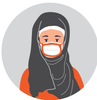
សាកប្រើប្រដាប់ ពាក់រឹតពីលើ ម៉ាស់ឬខ្សែចងអោយបាន ជិតល្អ