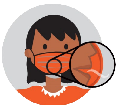
អាចអោយអ្នកដក ដង្ហើមបាន