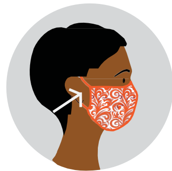
បិទជិតពីលើច្រមុះ និងមាត់ដោយ គ្មានចន្លោះ ចំហរធំ