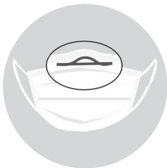
ពាក់ម៉ាស់ដែលមាន ខ្សែល្អសទាក់ ជាប់លើចុងច្រមុះ