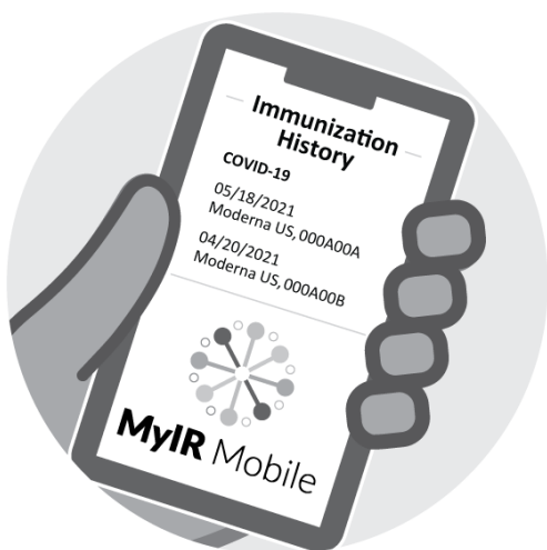
Registro en MyIRMobile.com o de otra aplicación