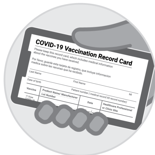
Fotografía de la tarjeta de vacunación