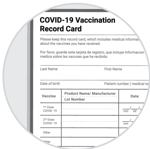
Tarjeta de vacunación

El condado de King requiere que este establecimiento exija la prueba de vacunación contra el COVID-19 o su examen o prueba negativa. Las formas válidas de verificación incluyen: