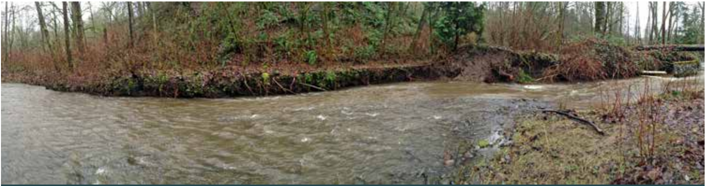
溪流氾濫已經侵蝕了保護著煤溪下水道管線的河床

本工程還能讓我們將很大一部分使用中的煤溪下水道從溪流及自然區域移走。歷年來，溪流氾濫侵蝕了河岸，管道已多次暴露出來。未來的洪水可能會損壞管道。