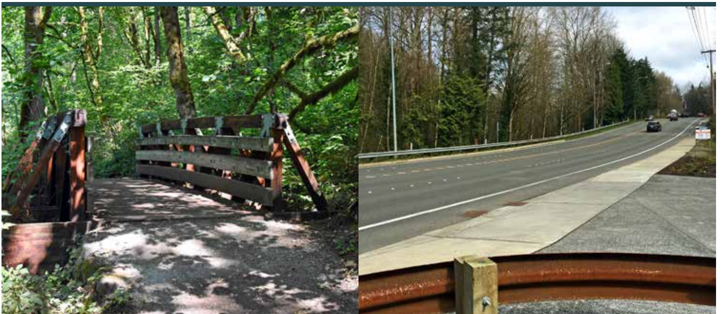
煤溪自然區域步道入口及Coal Creek Parkway (煤溪公園大道)

我們會在設計及施工期間與社區緊密合作。我們將為您提供最新資訊，聽取您的顧慮及建議，並盡可能減少施工造成的影響。您可以在整個項目過程中保持介入並了解最新資訊。請參看第三頁了解更多資訊。