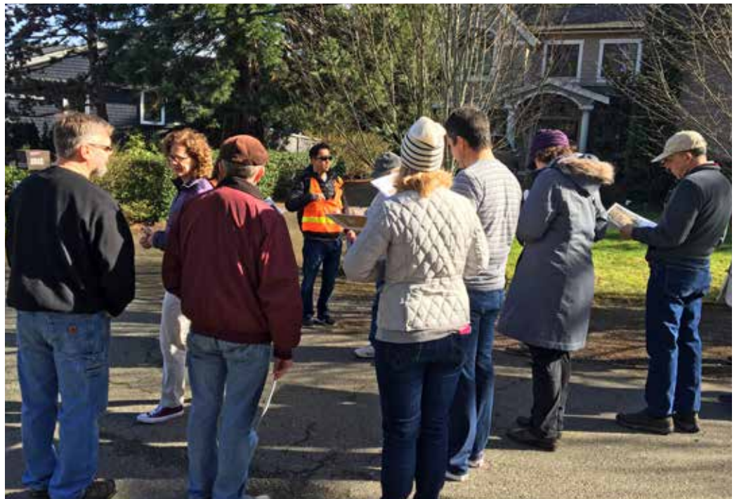
Cuộc họp cộng đồng

Nhóm dự án của Quận King biết rằng những người sinh sống trong khu vực dự án, các cơ sở kinh doanh trong khu vực, những người đi lại thường xuyên, và những người sử dụng công viên sẽ có rất nhiều câu hỏi. Nhóm dự án đảm bảo mọi người có cơ hội được gặp gỡ chúng tôi, đặt câu hỏi, đưa ra phản hồi và truyền tải những mối lo lắng của mình. Hãy cho chúng tôi biết liệu quý vị có quan tâm tới một cuộc họp hoặc buổi hướng dẫn cho nhóm hoặc tổ chức của quý vị, hoặc quý vị có mối bận tâm hay câu hỏi gì không. Vui lòng cho chúng tôi biết nếu quý vị cần dịch thuật hoặc cần có các hỗ trợ đặc biệt cho các cuộc họp!