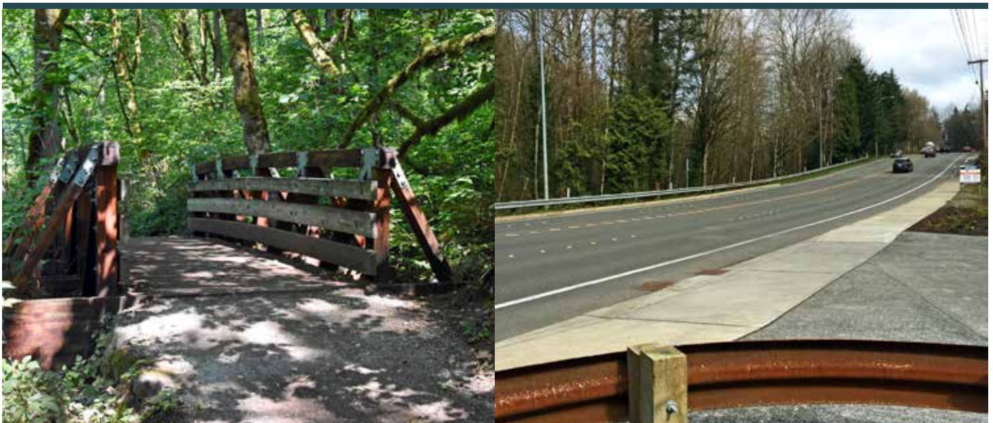
Đường mòn Khu Thiên nhiên Coal Creek và Đại lộ Coal Creek Parkway

Chúng tôi sẽ làm việc chặt chẽ với cộng đồng trong suốt quá trình thiết kế và xây dựng. Chúng tôi sẽ cập nhật tình hình, lắng nghe mối lo lắng và gợi ý của quý vị, và giảm các tác động của hoạt động xây dựng ở những nơi có thể. Quý vị có thể cập nhật thông tin và tham gia trong suốt dự án. Xem trang ba để biết thêm thông tin.