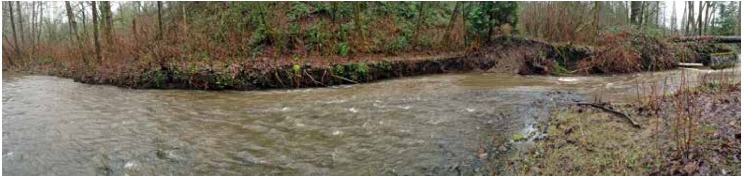
Lũ lụt ở nhánh sông đã làm xói mòn bờ sông nơi đặt Đường ống thoát nước Coal Creek

Dự án này cũng mang đến cho chúng ta cơ hội để di rời phần Đường ống thoát nước Coal Creek hiện đang hoạt động ra khỏi nhánh sông và khu vực thiên nhiên. Qua nhiều năm, lũ lụt ở vùng nhánh sông này đã làm cho hai bên bờ sông bị xói mòn và đường ống bị hở ra một vài lần. Các trận lũ lụt trong tương lai có thể phá hoại đường ống thoát nước.