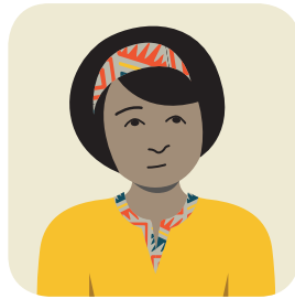
တီဘီရောဂါပိုး ကူးစက်ခံထားရသည် Has TB infection

It is important to take medicine for TB infection now.