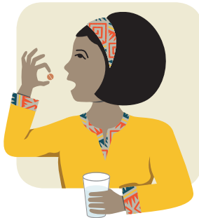
တီဘီဆေးကို သောက်သည် Takes TB medicine