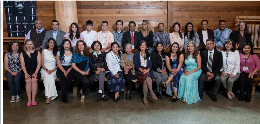
ក្នុងខែមិថុនា ទី៩ ក្រសួងសុខាភិបាលសុខភាពហើយនិងអង្គការការពារបរិស្ថានពិធីប្រគល់សញ្ញាបត្របញ្ចប់ការសិក្សាបណ្តុះបណ្តាលដែលមានការរួមសហការជាមួយនិងគូភាគីពីអ្នកភ្នាក់ងារសហគមន៍សុខភាព។