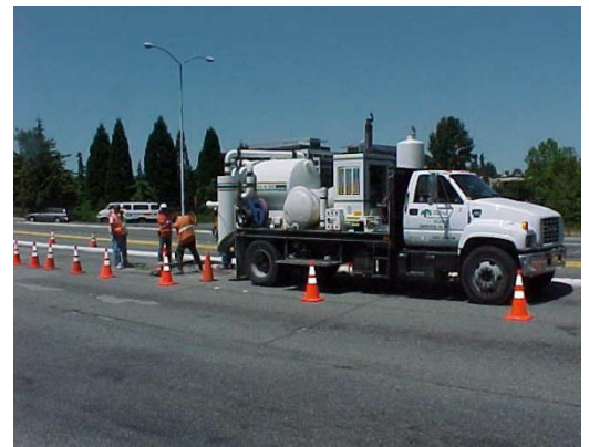
공공 서비스 설비 위치 확인에 사용되는 진공 트럭의 예

업무시간동안 포팅장소 근처에 차선, 자전거 전용도로, 인도가 폐쇄될 것 입니다. 그 지역을 안전하게 이동하기 위해 신호판과 교통 경비원들을 따르십시오!