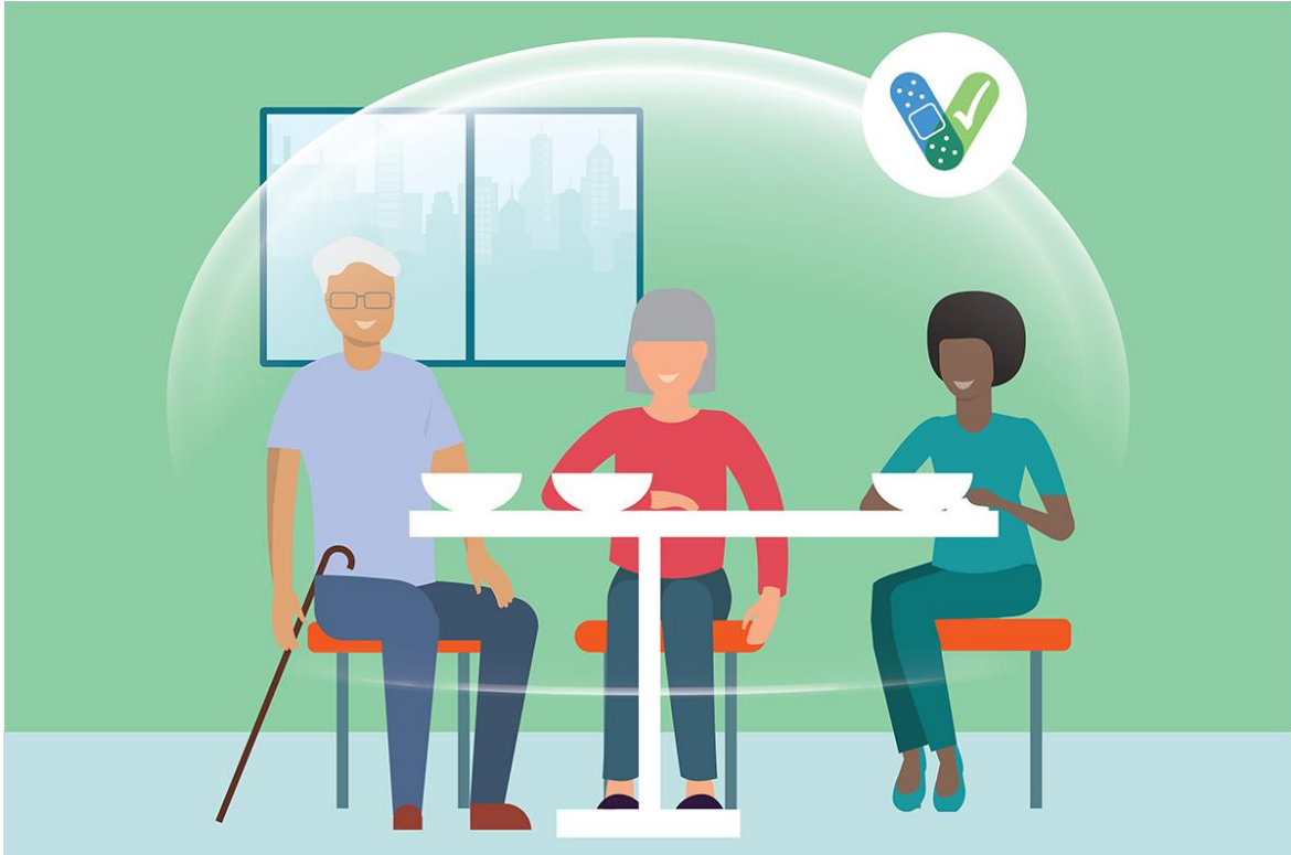
ኣብ ዉሽጢ ገዛ ሙሉ እና ብሙሉ እና ምስተኸተብኩ ሰባት ብዘይማስክ