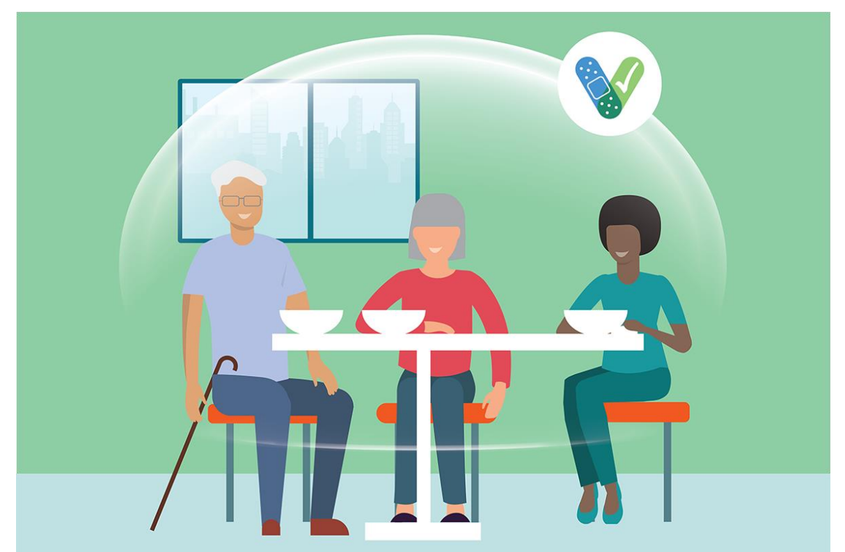
Tụ tập trong nhà với những người đã tiêm chủng đầy đủ, không cần đeo khẩu trang