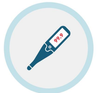
ሕማም ይስመዓኩም እንተደኣ ሃልዩ ኣብ ገዛኹም ጽንሑ