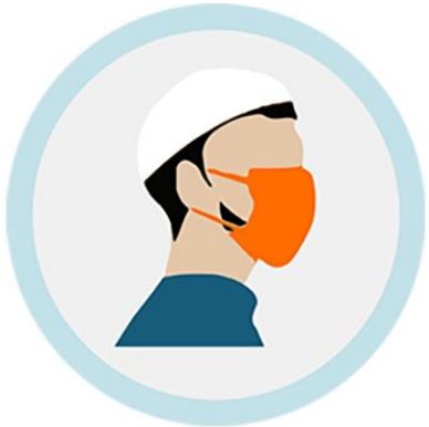
መሸፈኒ ገጽ ግበሩ (እንተላይ ኢማምን፡ 5 ዓመትን ልዕሊኡን ዝዕድሚኦምን)