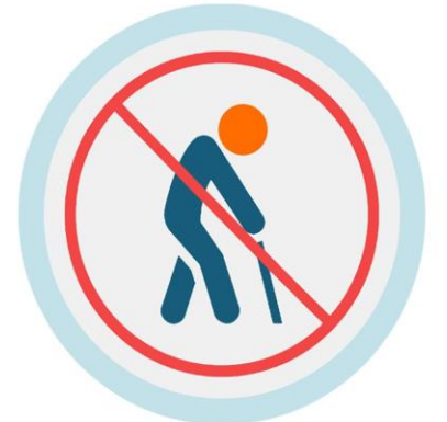
ዓበይቲ 60 ዓመትን ልዕሊኡን ኣብ ገዝኦም ከይኖሩ ክጽልዩ ኣለዎም