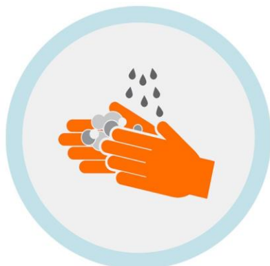
ዉዱእ (wudhu) ኣብ ገዛኹም ግበሩ