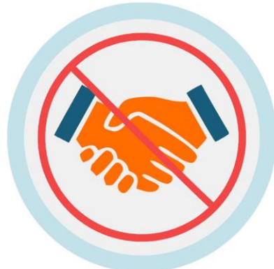
ናይ ኢድ ሰላምታ (ምጭብባጥ) ኣይትግበሩ