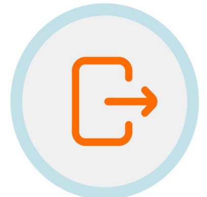
ድሕሪ ሰላት ብኡንቡኡ ካብ መስጊድ ዉዱ