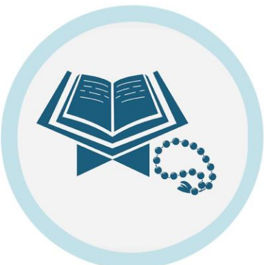
ዝኾነ ኣቕሑት ወይ ዝንበብ ብሓባር ኣይትጠቐሙ (ነናትኩም መጽሓፍ ይሃልኹም፡ ከናፍርኩም ኣይትሓዙ)