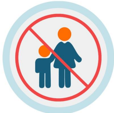
ትሕቲ 10 ዓመት ዝዕድሚኦም ቆልዑ ኣብ ገዝኦም ክጸንሑ ይግባእ