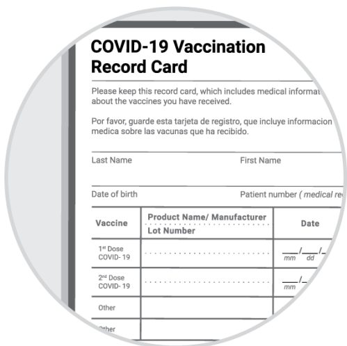
Carte de vaccination