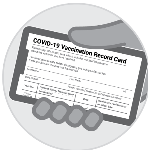
Photo de la carte de vaccination