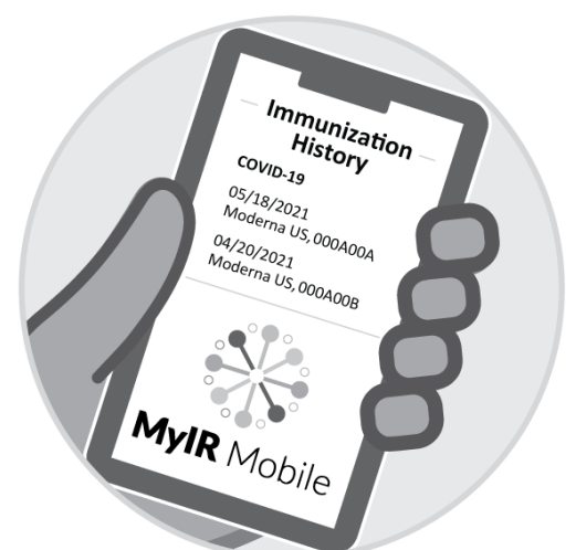
Justificatif de MyIRMobile.com ou d'une autre app