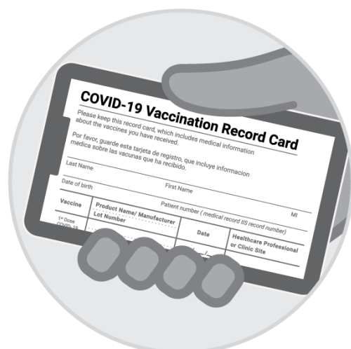
Ảnh của thẻ tiêm chủng