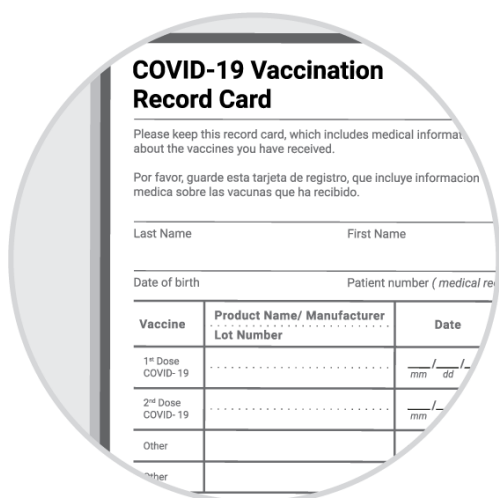
Thẻ tiêm chủng

Quận King yêu cầu bằng chứng tiêm chủng COVID-19 hoặc kết quả xét nghiệm âm tính tại địa điểm này. Các hình thức xác minh hợp lệ bao gồm: