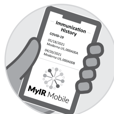
Zapis z MyIRMobile.com lub innej aplikacji