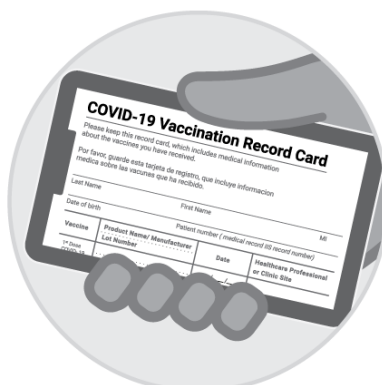
Zdjęcie karty szczepienia