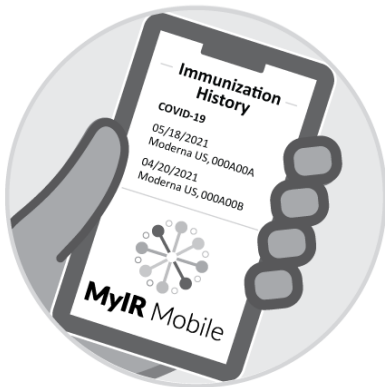
Запись с MyIRMobile.com или другого приложения