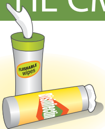
Протирающие и дезинфицирующие салфетки