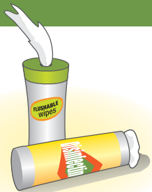
Toallitas húmedas para limpiar